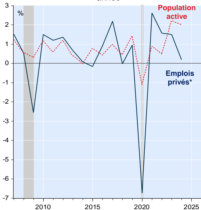
Croissance en % de l'emploi privé et de la population active au cours des 8 premiers mois de chaque année